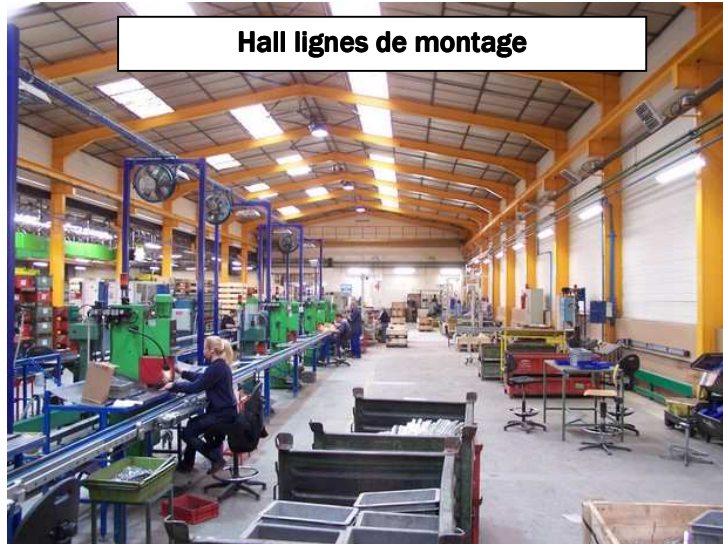
Hall lignes de montage