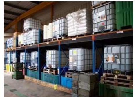
Stockage produits chimiques