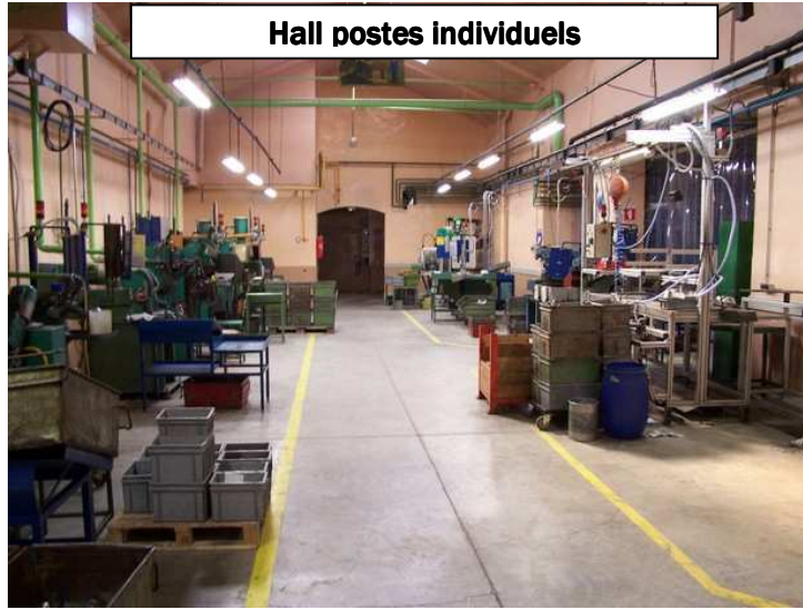
Hall postes individuels