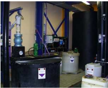
Traitement des effluents