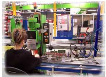
Postes semi-automatisés sur lignes de montage