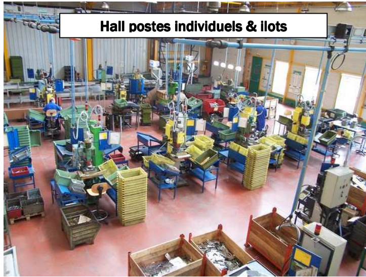
Hall postes individuels & ilots