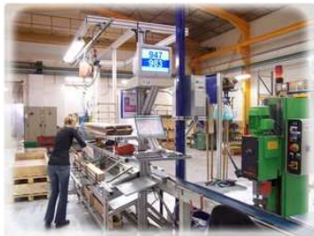
Lignes de montage avec écran de suivi des objectifs